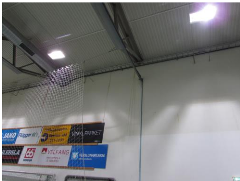
Mynd 1 Taumar innanhúss á suðurhlíð

Byrjað var á að skoða þakið innanfrá. Töluverð ummerki eru um leka á útveggjum byggingarinnar innanhúss. Taumar eru niður veggina. Aðallega er þetta sýnilegt á suðurhlíðinni en einnig má sjá sömu ummerki á norðurveggnum. Ekki eru merkjanlegir neinir lekar á þekjunum annarsstæðar. Sjá myndir 1 og 2.