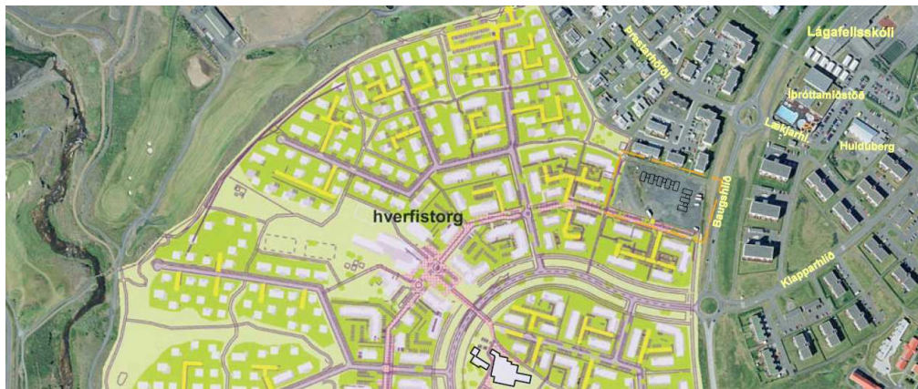
Fylgiskjal 2. Skólar í framtíðinni í Blikastaðalandi:

Gert er ráð fyrir tveimur skólahverfum í Blikastaðalandi. Í norðurhverfinu er gert ráð fyrir 1000 íbúðum, þar af eru 120 íbúðir sem í dag er þratarhöfði. 880 íbúðir eru áætlaðar til viðbótar innan norðurhverfisins. Í suðurhverfinu er reiknað með 960 íbúðum.